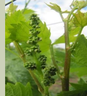
Στάδιο G διαμορφωμένες ταξιανθίες.

Στάδιο D,E Somguard 0,3-0,5 % Bindou 0,01% μετά 5-6 ημέρες να γίνει εμβολιασμός.