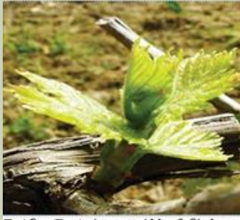
Στάδιο E : Δεύτερο φύλλο ξεδιπλωτό και απομάκρυνση από την κληματίδα