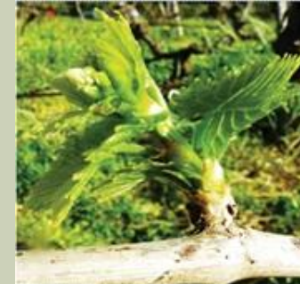
Στάδιο F : 4-5 ξεδιπλωμένα φύλλα και εμφάνιση σταφυλιών.